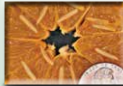
柑橘上的果蠅幼蟲